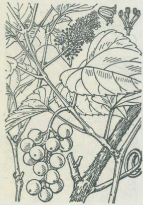
第 3445 図