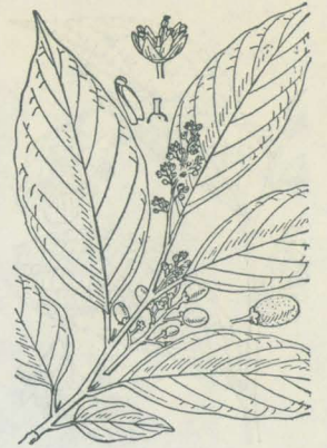
第 3447 図