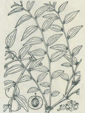
第 3448 図