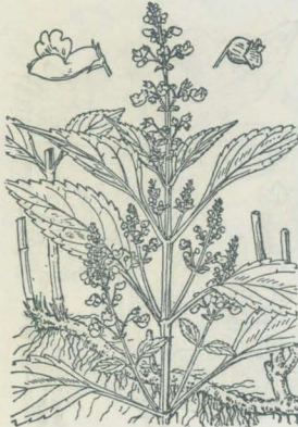
第 3343 図