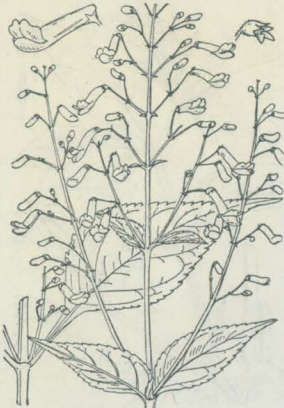
第 3342 図