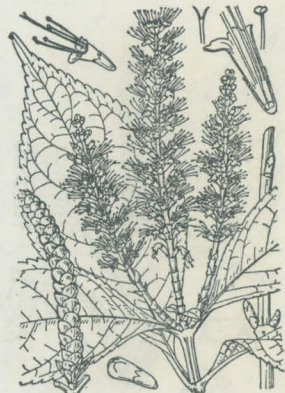
第 3345 図