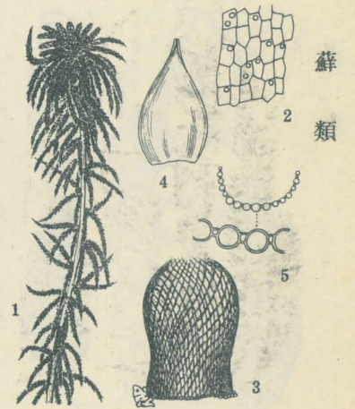
第 2977 圖

濕地ニ生ジ、黄褐綠色。莖ノ表皮細胞ハ二乃至四層、最外層ノ表面ニハ一ノ圓形孔アリ。枝ハ五箇位叢生。莖葉ハ舌狀、頂端少シク截頭ニシテ總狀ノ裂片アリ。枝葉ハ廣楕圓形、銳頭部ハ溝狀ニ凹ミテ截頭。葉綠細胞ノ横斷面ハ稍方形ニシテ透明、透明細胞ハ兩面ニ突出ス。1 全形(3/5大) 2 莖ノ最外表皮ノ外面 3 莖葉 4 枝葉 5 枝葉ノ横斷面。