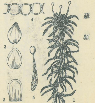
第 2978 圖

多濕地ニ生ジ、淡褐綠色。莖ハ直立シ、枝ハ叢ヲナス、展開枝三、下垂枝二ヨリ成ル。莖葉ハ粗ニ生ジテ倒卵狀舌形。枝葉ハ密生シ、廣卵狀鈍頭、舟形ニ凹ム、ソノ横斷面ニテ葉綠體ヲ含ム細胞ハ梯形ヲナシ、透明細胞ハ下面ニ凸出ス。1 全形(約3/5大) 2 莖葉 3 枝葉 上ハ自然形、下ハ展開セルモノ 4 枝葉ノ横斷面 5 子囊ヲ附ケタル枝。