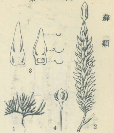
第 2976 圖

高山ノ岩上ニ生ジ、帶黑赤褐色。莖ハ直立シ多數ニ分枝ス。葉ハ卵狀披針形ニシテ銳頭、中肋ナシ、上部ノ細胞ハ方形ニシテ、背面ニ一箇ノ大ナル乳頭アリ。子囊ハ 1.6mm ノ柄上ニアリテ卵狀長楕圓形、熟シテ四縦裂開ス。藓蓋及縁齒ナシ。1 全形(3/5大) 2 子囊アル枝 3 葉及ソノ横斷面 4 裂開セル子囊。