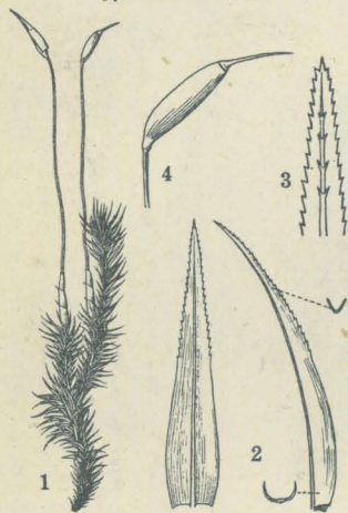
第 2968 圖