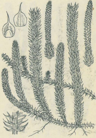
第 2917 圖