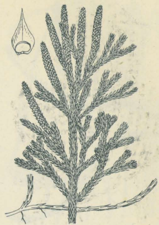
第 2916 圖