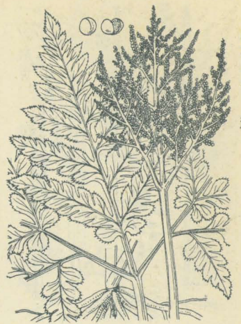
第 2898 圖

丘阜地ノ林中等ニ生ズル多年生ノ羊齒草本ニシテ夏時ニハ其葉枯槁シ或ハ宿存ス。根莖ハ地中ニ在リテ傾斜シ粗ナル鬚根ヲ發出ス。葉ハ長柄ヲ有シテ根莖ヨリ立ち、高サ30-50cm許アリテ基部ヨリ二岐シ、一ハ裸葉ト成リ、一ハ孢子葉ト成リ、全體無毛ナリ。裸葉ハ軟キ草質ニシテ綠色或ハ褐色ヲ呈シ、略ボ五角形ニシテ單或ハ再羽状ヲ成シ、最下ノ羽片ハ最モ大ニシテ長柄ヲ有シ、上部ノ者ハ漸次ニ小形狭長ト成リ無柄ニシテ葉面中軸ニ融着シ、最終裂片ハ廣橢圓形ニシテ幅5-6mm、圓頭ヲ有シ、稍粗ナル尖鋸齒アリ。孢子葉ハ頂生ノ穗ヲ成シ分枝シ、小枝上ニ多數ノ子囊ヲ並列ス。ふゆのはなわらびニ酷似スルモ分裂淺ク且裂片大形ニシテ粗鋸齒ヲ有スルヲ以テ容易ニ識別セラル。和名ハ大花蕨ニシテ大形ナルはなわらびノ意ナリ。