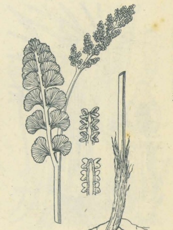
第 2900 圖