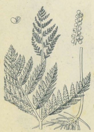
第 2897 圖

山地或ハ原野向陽ノ草地ニ散生スル多年生ノ羊齒草本ニシテ夏ハ其葉枯ル、全體毛無クシテ質厚シ。根莖アリテ粗大肉ナル鬚根ヲ發出シ、頂ニ一葉柄ヲ出セリ。葉ハ直立シ高サ30-50cm、葉柄ハ基部ヨリ二岐シテ一ハ裸葉即チ榮養葉ヲ有シ他ノ一ハ孢子葉ヲ有ス。裸葉ハ外形三角状或ハ五角状ニシテ二-三回羽裂ヲ成ス。羽片ハ基部即チ最下ノ者長柄ヲ有シ且最モ大形ニシテ長三角形ヲ成シ、他ノ羽片ハ無柄ニシテ披針形ヲ呈シ、小羽片ハ長卵形或ハ卵形ヲ成シ羽片外側ノ最小羽片者ハ他ヨリ大ナリ、最終裂片ハ幅2-3mm、長橢圓状或ハ卵形ヲ呈シ圓頭ヲ有シ、尖リタル細鋸齒アリ。其葉柄稀ニ更ニ兩岐シテ二葉面ヲ成スコトアリ。葉色ハ綠色ナレドモ陽光ヲ受ケテ往々赤褐色ヲ呈セリ。孢子葉ハ頂生ノ穗ヲ成シテ分枝シ小枝上ニ多數ノ子囊ヲ並列シ黄色ヲ呈シテ粟粒ノ如シ、和名冬之花蕨ハ冬季ニ新葉ヲ生ジ且孢子穗ヲ生ズルニヨリ此稱アリ、冬蕨・寒蕨ハ共ニ寒中ニ生ズルヨリ云ヒ、日陰蕨ハ日ノ當ラヌ地ニ生ズルノ意、常蕨ハ殆ンド年中在ルヨリ斯ク云フ。