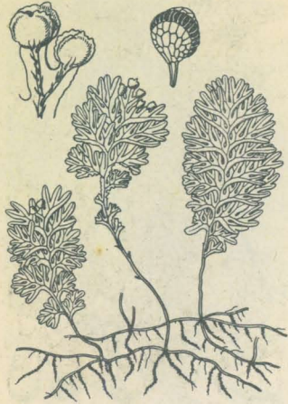
第 2884 圖