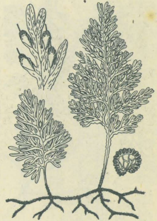
第 2888 圖