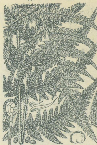
第 2857 圖