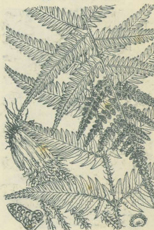
第 2858 圖