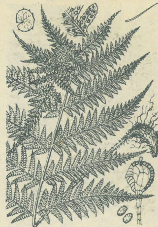
第 2845 圖