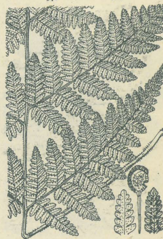
第 2846 圖