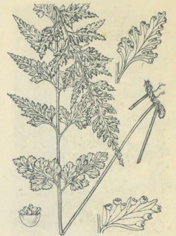
第 2821 圖