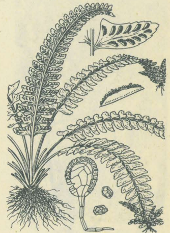
第 2786 圖