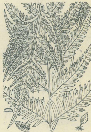
第 2780 圖