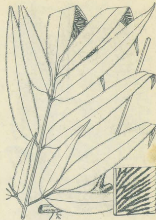
第 2779 圖