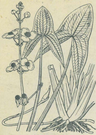
第 2657 圖