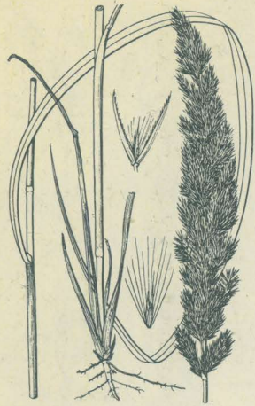
第 2555 圖