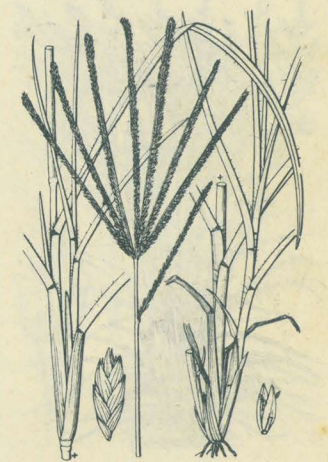
第 2559 圖