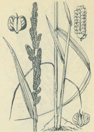
第 2558 圖