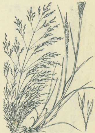
第 2547 圖