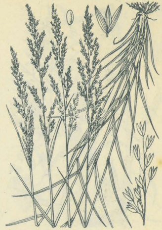
第 2546 圖