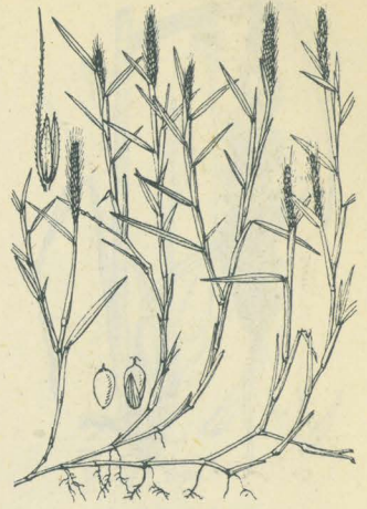
第 2522 圖