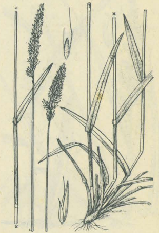
第 2523 圖