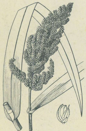
第 2508 圖

陸地并ニ水田ニ栽培セラルル一年生草本ニシテ高サ 1-2mニ達ス。稈ハ粗大ニシテ直立ス。葉ハ線狀披針形 ヲ成シ先端漸次ニ鋭尖シ、細線齒アリ、幅3cm許ニシ テ長鞘ヲ有シ、小舌ヲ缺ク。秋時稈頂ニ圓錐花穂ヲ抽 キテ直上ス、穂ハ粗大ナル圓錐狀ヲ成シテ稍長圓錐形 ヲ呈シ、枝穂モ亦圓錐狀ヲ成シテ甚ダ密ニ淡綠色或ハ 褐紫色ノ花ヲ着ケ、穂軸ニハ白色ノ剛毛アリ。小穂ハ 小ニシテ一花ヨリ成リ、無芒或ハ有芒ナリ。外穎ハ小 形、内穎及ビ外稃ハ略同形同大、表面有毛。内穎外稃ハ 軟骨質ニシテ光澤アリ。三雄蕊一雌蕊アリ。穎果ハ碎 小ナレドモ人ノ食用トシ又鳥ノ飼料ニ利用ス。ひえハ 畑ニ作ル者ト水田ニ植ウル者トアリテ畑種ヲはたび えト云ヒ、水田種ヲたびえト呼ビ、其長キ紫芒アル品 ヲけいぬびえ一名くまびえ (f. aristatum Makino)ト云 ヒ (湖南稗子ハ之レヲ指ス)、無芒品ヲわさびえト稱シ (光頭稗子?)、短芒アル品ヲむくろちト云ヘリ、和名 ひえハ日毎ニ盛ニ茂レバ日得ノ義ナリト謂ハルレ ドモ果シテ然ル乎否乎、或ハひえハ稗ノ字音ヨリ出デ シ語ニハひア申ベ補ヒシ音ナリト謂フハ果シテ信乎。