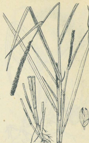
第 2510 圖