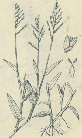
第 2504 圖