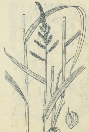
第 2505 圖