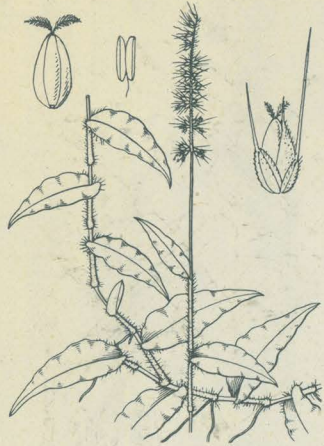
第 2501 圖