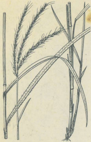
第 2464 圖