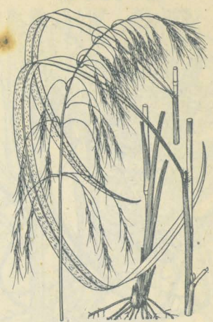
第 2467 圖

山野ニ生ズル大形ノ多年生草本ニシテ叢生ス。稈ハ直立シ高サ90-120cm許アリテ葉ヨリ高ク、平滑ナル圓柱形ニシテ油氣アリ。葉ハ根生竝ニ稈ニ互生シ線狀披針形ニシテ末漸次ニ尖リ幅時ニ2cmニ達シ粗毛アリ、下方ノ者ハ特ニ長柄ヲ有シ、下部ハ長鞘ヲ成ス。秋月、稈頂ニ散漫セル大ナル圓錐花序ヲ成シテ大抵一方ニ傾キ、主軸ノ各節ヨリ輪生狀ニ數本ノ鬚狀梗ヲ出シテ穂狀花穂ヲ垂下シ、各穂軸ノ各節ニ二小穂ヲ着ケ一ハ短柄一ハ長柄ヲ有シ、熟スレバ柄ヲ殘シテ脱落ス。小穂ハ長サ5mm許、第一第二ノ穎ハ淡綠色ニテ外面ニ白毛ヲ帯ビ、外稃ハ薄膜質、内稃ハ先端深ク二裂シ其中間ニ長芒ヲ具ヘテ長サ小穂ニ二倍シ紫色ヲ帯ブ。三雄蕊アリ。花柱ハ柱頭長クシテ筆毛狀ヲ呈ス。和名油すすきハ其稈ニ油氣油臭アルヲ以テ云フ。