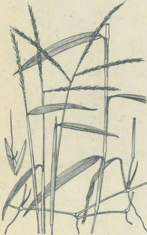
第 2465 圖

我邦温暖諸州ノ山野向陽乾地ニ生ズル中等大ノ多年生草本ニシテ叢生シ、高サ80-90cm許アリ。稈ハ脊長ナル平滑圓柱形ニシテ節ニ毛アリ。葉ハ狭線形ニシテ末長ク尖リ兩面ニ伏毛ヲ疎布シ下部ハ稈ヲ包メル長鞘ヲ成シテ通常毛ヲ布ク。秋月、葉ヨリ高キ稈頂ニ掌狀花序ヲ成シテ短キ總軸ヲ具ヘ三乃至五條ノ花穂ヲ有シ淡黄褐色ヲ呈シテ往々稍一方ニ傾キ相接シテ多數ノ小穂ヲ着ケ穂長10cm許アリ、穂軸ハ白色或ハ淡紫色ノ細毛ニ被ハル。小穂ハ雙生シ其一ハ無柄、其一ハ有柄ニシテ共ニ廣披針形ヲ成シ長芒ヲ具ヘ、總苞毛ハ長シ。和名小かりやすハかりやすニ似テ小形ナレバ云フ、之レヲかりやすト呼ブ處アルハ多分本草ヲ染料ニ使用スルヲ以テ謂フナラン、らんぬけもどきハ其全草らんぬけニ酷似セルヨリ斯ク云フ。