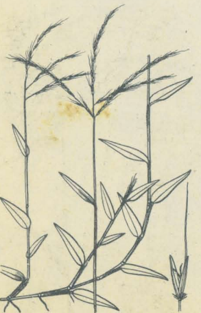
第 2466 圖

原野到ル處ニ多キ一年生草本ニシテ高サ 60-90 cm許アリ。稈ハ弱質ニシテ立ち瘦長ナル圓柱形ニシテ綠色ヲ呈シ平滑ニシテ節稍高シ、下部ハ分枝シ又多少匍匐シ各節ヨリ發根ス。葉ハ疎ニ稈ニ互生シ線狀披針形ヲ成シテ尖リ質薄クシテ短毛アリ、下ハ長鞘ヲ成シテ稈ヲ包ム。秋時、稈頂ニ細長ナル綠色ノ花穂ヲ抽キ二乃至六條ニ分岐シテ略ボ掌狀ニ排列シ、瘠者ハ單穂ヲ成シ、穂上各節ニ長サ5mm許ノ小穂ヲ二箇宛生ジ、其中ノ一箇ハ無柄ナリ。第一、第二ノ穎ハ綠色ニシテ質軟ク、第三穎ハ缺如シ、外稃ハ細小、内稃ニハ長芒アリテ芒長ハ小穂ニ二倍シ、其先端ニ斗出シ、又無芒ノ者アリ之レヲのぎなしあしほそト云フ。和名あしほそハ蓋シ脚細ノ意ニシテ其脚部ノ稈却テ其上部ヨリ瘦細ナルヨリ云フナラン。