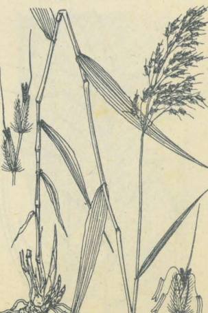
第 2469 圖

主トシテ我邦中部位ニ東北地方ノ深山ニ多キ多年生草本ニシテ叢生シ、根莖ハ短クシテ不規則ノ塊様ヲ成シ質硬シ。稈ハ直立シ高サ60-90cm許アリテ頗ル瘦長ナリ、往々微シク之曲ス。葉ハ互生シ披針形又ハ線狀披針形ヲ成シテ鋭ク尖リ、毛ヲ有セズ、下ハ長鞘ヲ成シテ稈ヲ包メリ。夏日、葉ヨリハ上ニ稈ヲ挺出シテ圓錐狀ヲ成セル淡綠色ノ花穂ヲ着ケ、花穂ハ稍短小ニシテ、枝花穂ハ鬚髮狀ノ花梗ニ小軸ヲ有シ、少數ノ小穂ヨリ成ル。小穂ハ披針形ニシテ其内外ノ穎面ハ白色ノ長軟毛ニ被ハレ、内稃ニ屈曲セル一長芒ヲ具フ。和名ハ小油すすきニシテ小形油すすキノ意 深山油すすきは深山ニ生ズルヨリ云フ。