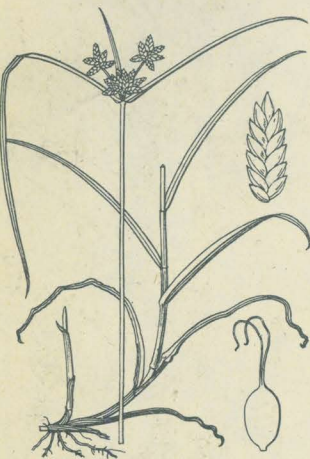
第 2453 圖

かはらすがな Cyperus sanguinolentus Vahl. (= Pycreus sanguinolentus Nees; C. Eragrostis Vahl.)