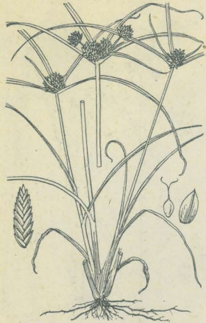
第 2452 圖

あながやつり 一名 おほたまがやつり Cyperus nipponicus Franch. et Sav. (= C. pygmaeus Rottb. non Retz.; Juncellus pygmaeus Clarke.)