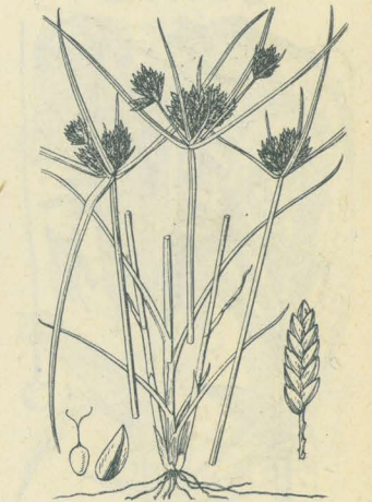
第 2456 圖

中部以北ノ水濕地ニ生ズル大形ノ一年生草本ニシテ多少叢生シ、鬚根ヲ叢出ス。高サ50-70cm許アリテ直立ス。葉ハ廣線形ヲ成シ末ハ長ク漸尖シ稈ト同高ニシテ質厚ク幅1cmアリ、下部ハ鞘ヲ成シテ稈ノ下方ヲ包メリ。稈ハ聳立シ粗大ニシテ三稜柱狀ヲ成シ基部ハ往々肥厚ス。秋月、稈頂ニ三乃至六片ノ長キ葉狀苞アリテ其葉心ニ數箇ノ復生ノ繖形花穂ヲ出ダシ、繖梗ハ直立シ長キハ10cmニ超ユ。穂狀花穂ハ圓柱形或ハ長橢圓形或ハ橢圓形ヲ成シテ初メ白綠色ナレドモ後テ黃褐色ヲ呈シ、密ニ多數ノ小穂ヲ着ク。小穂ハ線狀披針形ニシテ十五花内外ヨリ成リテ二列ニ排ビ、長サ5mm内外アリ。穎ハ乾皮質、長橢圓狀披針形ニシテ鈍頭、背部ハ綠色ヲ混ジ、小穂軸ニ對シ殆ンド開出セザルヲ以テ小穂ハ著クニ尖レル觀ヲ呈ス。三雄蓋アリ。蒴ハ長橢圓形ニシテ三稜ヲ成シ穎ヨリ短クシテ暗色ヲ呈シ、花柱ハ三岐ス。和名ハ沼蚊帳釣ニシテ沼地ニ生ズルヨリ云フ。