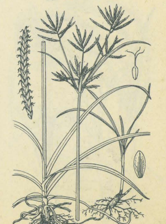
第 2457 圖

はますげ (莎草) 一名 くぐ (『倭名類聚鈔』) Cyperus rotundus L.