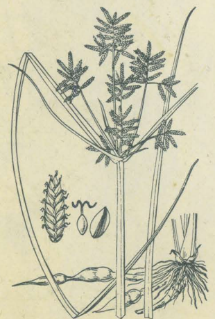
第 2454 圖

みつがやつり 一名 おほがやつり Cyperus serotinus Rottb. (= Juncus serotinus Clarke.; C. Monti L. fil.; C. japonicus Miq.)