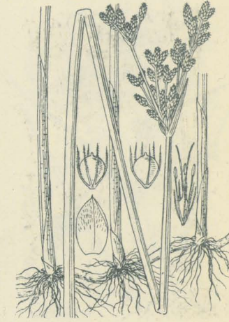
第 2433 圖