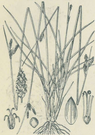
第 2417 圖

原野ノ向陽濕地ニ生ズル一年生草本ニシテ叢生シ、高サ10-12cm許アリ、根ハ鬚狀ナリ。葉ハ多數根生シ細長ニシテ稍短ク綠色ヲ呈セリ。夏秋ノ候、叢葉中ヨリ多數ノ直立稈ヲ抽キテ葉上ニ超出シ、梢上繖形ニ梗ヲ出シ每梗一二回小梗ヲ分チ各小梗頂ニ淡褐色ニシテ長サ4mm許ナル長橢圓形ノ小穂ヲ生ズ。總苞葉ハ芒狀ヲ成シ大小不同ニシテ數條アリ、長サ3cmニ達スル者アリ。穎ハ卵形ニシテ銳頭微凸尖アリ、淡褐色ナレドモ背線ハ綠色ヲ呈ス。穎内ニ一瘦果アリテ淡黃色倒卵狀ヲ成シ、表面平滑ナリ。花柱ハ先端二岐シ果時其下部ニモヲ有セズ。和名ハ小畦點突ニシテあぜてんつきニ似テ小形ナルヨリ云フ。