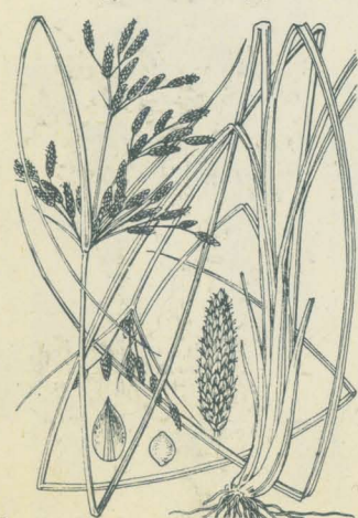
第 2418 圖

向陽ノ地或ハ島嶼地ニ生ズル多年生草本ニシテ叢生シ、鬚根ハ地中ニ深入シテ強シ。葉ハ狭線形ヲ成シ質剛クシテ下部ハ褐色ノ膜質鞘ヲ成ス。夏秋ノ候、葉間ヨリ稈ヲ抽テ直立スルコト20-35cm許、稈頂ニ單繖形ヲ成シテ少數ノ細梗ヲ出シ梗端ニ小穂ヲ着ケ、花序下ノ總苞葉ハ一箇長ク延ビテ花序ヨリ超出ス。小穂ハ長サ1-1.5cmニ達シ線狀長橢圓形ニシテ茶褐色ヲ呈ス。穎ハ卵形鈍頭微凸尖ヲ有シ、背線綠色ヲ成シ、穎内ニ三雄蕊并ニ稍扁平倒卵形ノ瘦果ヲ有シ果面滑澤ニシテ褐色ナリ、花柱ハ扁平ニシテ二岐ス。和名ハ島點突ニシテ往々島地ニ生ズルヨリ名ク。