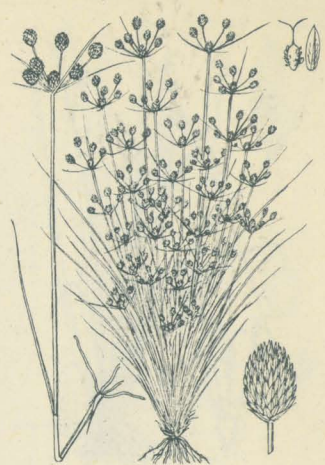
第 2419 圖

海ニ接スル向陽ノ濕地草間ニ生ズル多年生草本ニシテ高く直立叢生シテ高サヲ50-70cm許アリ、株本ハ肥厚シテ鬚根ヲ具フ。葉ハ粗剛ニシテ狭線形ヲ成シ稈ヨリ短シ。夏秋ノ間、高ク葉間ヨリ抽キタル稈頂苞葉間ニ數梗ヲ抽キ二三回分枝シテ各小梗先端ニ長サ1.2cm許ノ茶褐色線狀長橢圓形ノ小穂ヲ有ス。總苞葉ハ二三條アリテ葉狀ヲ成シ長短不同、其長キ者ハ20cmニ達ス。穎ハ革質卵形ニシテ光澤アリ褐色ヲ呈シ背線ハ綠色ニシテ先端微凸頭アリ、穎内ニ三雄蕊アリ。瘦果ハ稍扁平倒卵形ヲ成シ表面小格子狀網理アリテ黃白色ヲ呈シ、花柱ハ扁平ニシテ二岐セリ。和名ハ大點突ノ意ニシテ草狀大ナルヨリ云フ。