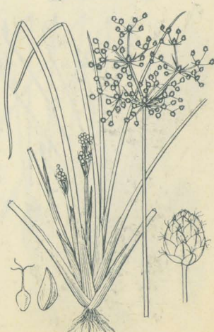
第 2421 圖

海濱砂場ノ向陽地ニ生ズル多年生ノ小草本ナリ。株頭多岐叢生シテ往々窠ヲ成シ、根莖ハ斜上シ長キ鬚根ヲ生ジ香氣アリ。葉ハ多數ニシテ狭線形ヲ成シ其質脆剛ニシテ上面溝ヲ成シテ綠色、下面ニ灰白色細毛ヲ密布シ常ニ背方ニ彎曲シテ基部ハ鞘ヲ成ス。稈ハ數條叢葉間ニ直立シテ高サ10-20cm許、硬質ニシテ稈面ハ葉ト同ジク灰白色細毛ヲ布ク。夏秋ノ候稈頂ニ繖形花序ヲ成シ單生或ハ複生シ、下ニ短キ少數總苞アリ。小穂ハ各繖梗上三五箇簇生シ、稍大形ノ卵狀長橢圓形ヲ呈シ、線褐色ヲ呈ス。穎ハ直立シテ相接在シ卵形、有脊。瘦果ハ穎ヨリ短クシテ兩凸面形ナル倒卵形ヲ呈シ、花柱ハ瘦果ト同長ニシテ二岐セリ。和名天鷲絨點突ハ其體上ノ軟絨毛ニ基キシ名ナリ。