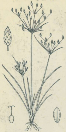
第 2416 圖