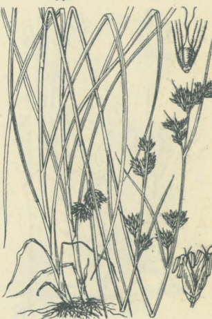
第 2403 圖