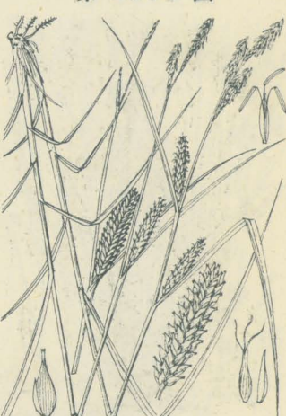
第 2397 圖