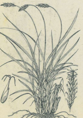
第 2340 圖

南支那ノ原産ニシテ徳川時代ニ琉球ヨリ渡來シ、今ハ諸處ニ觀賞植物トシテ培養スル常緑灌木ニシテ叢生シ、短キ地下枝ヲ横出シテ繁殖シ、高サ1-2m許。稈ハ直立シ、徑2cm内外、分枝ナク稈身ハ舊葉鞘ノ纖維ニテ密包シ、若シ稈面露出セバ綠色ヲ呈ス。葉ハ稈頂ニ聚リテ四方ニ出デ、葉柄ハ細長ナレドモ強剛、葉面ト同長、基部葉鞘部ノ兩緣ニハ黒褐色ノ纖維アリテ莖ヲ抱擁ス。葉面ハ概形扇狀ヲ呈シ四乃至八片ニ掌狀深裂アリ、長サ15-25cm許、裂片ハ狭長長橢圓形、幅3cm内外、縱裂アリテ前方多ク膨起シ、先端ハ四五裂シ、剛質深緑滑澤、邊緣ニ鋸齒アリ。雌雄異株。初夏ノ候往々開花ス。花序ハ長サ20-30cm、葉間ニ在リ、總狀花序ハ疎ニ圓錐狀ヲ成シ、花ハ無柄小形球形、淡黃色ニシテ外花蓋ハ短クシテ杯狀三淺裂、内花蓋ハ倒卵狀球形三裂。雄蕊ハ六。子房ハ三。果實ハ廣橢圓球形、外面ニ反屈セル硬質鱗片多シ。本品之レヨリしゅろちくニ比スレバ葉ノ裂片少數且ツ廣闊、先端ハ葉面膨起シ、質強剛ナルヲ以テ區別シ得ベシ。和名ハ觀音竹ノ意、元來此觀音竹ハ漢名ニ非ズ、是レハ蓋シ琉球ノ寺號觀音山ヨリ出デシ者ニシテ多分同寺ニ之レガ栽エアリシヨリ此稱ヲ生ゼシナラン。