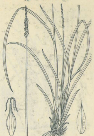
第 2341 圖

野外ノ多濕地ニ生ズル多年生草本ニシテ高サ30-40cmアリ。根莖ハ粗ナル線形ニシテ稍斜上シ、此レヨリ稈并ニ葉ヲ簇生ス。葉ハ廣線形、幅4mm内外ニシテ稈ト共ニ軟弱ナリ。五月ノ候、三稜形糙澁ノ綠色稈ヲ直立シ、頂ニ一花穂ヲ着ク。花穂ハ長サ2-3cm、圓柱狀ヲ呈シ、上部三分ノ一乃至四分ノ一ハ雄花部ニシテ細ク且ツ淡黄褐色ヲ呈シ、下部ハ稍疎ニ花軸ニ着ケル雌花ヨリ成ル。穎ハ膜質、橢圓形ニシテ綠青、且ツ芒アリ。果囊ハ之レヨリ長ク軸ニ對シテ開出シ、綠色無毛ニシテ銳尖頭、隆起セル數條ノ綠白脈ヲ有ス。瘦果ハ倒卵形ニシテ三稜狀ヲ成シ、三柱頭アリ。和名白子蓋ハ最初武州白子ノ地ニ於テ採集セシヲ以テ此名ヲ得タリ。