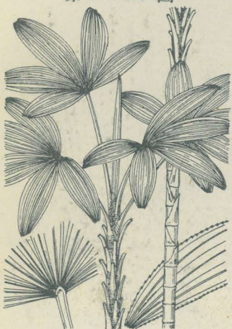
第 2339 圖

南支那ノ原産ニシテ舊ク徳川時代ニ琉球ヨリ渡來シ、今ハ諸處ノ庭園ニ觀賞植物トシテ栽植セラルル常緑灌木ニシテ叢生シ、短キ地下枝ヲ横出シテ繁殖ス。稈ハ高サ3m内外ニ達シ、直立單一、圓柱形ニシテ節多ク、徑1-2.5cm許、稈身ハ舊葉鞘ノ纖維ヲ以テ緊包シ若シ其稈ノ表面露出セバ綠色ヲ呈シ、稈頂ニ七八葉ヲ開出シ、葉柄ハ細長ナレドモ強剛、半圓柱狀ヲ成シ、葉面ハ扇形ニ展開シ、十乃至十八片許ニ掌狀深裂シ、裂片ハ廣線形、漸尖頭ニシテ先端二三ノ裂線ヲ存シ、縱裂ハ顯著ナラズシテ平坦、主要脈三四縱走シ薄キ革質ニシテ暗綠色或ハ鮮綠色ヲ呈シ滑澤、邊緣ニ微鋸齒アリ。雌雄異株。夏月往々葉腋ニ花序ヲ出ダシ、脚部ハ褐色強質ノ鞘色アリ。花穂ハ總狀花序ヲ集メテ圓錐狀ヲ成シ疎ニシテ多少下垂ス。花ハ小ニシテ無柄、小球狀ノ花蓋ハ淡黃色ヲ呈シ、外花蓋ハ短クシテ杯狀三淺裂、内花蓋ハ倒卵狀球形、三裂。雄蕊ハ六、子房ハ三。葉狀しゅろニ近ケレドモ裂片小形、中脈ハ缺キ質薄ク且ツ邊緣ニ鋸齒ヲ存シ、乾ケバ横脈現ルルヲ以テ區別シ得ベシ。和名ハ櫻欄竹ニシテ葉ハしゅろニ類シ稈ハ竹ニ似タルニ由ル。いぬしゅろちくハ元來本種ノ名ニシテくわんのんちくノ一名ニ非ズ。本來しゅろちくノ名ハ此類ノ總名ナリシナリ。