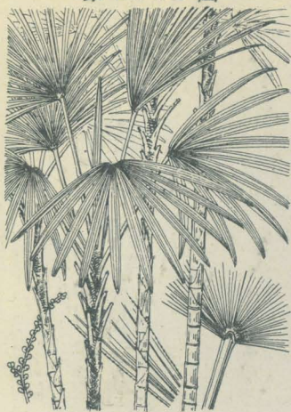
第 2338 圖