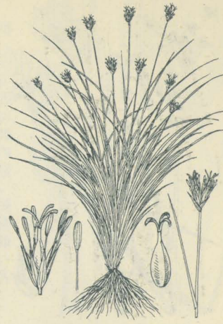
第 2294 圖