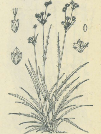
第 2289 圖