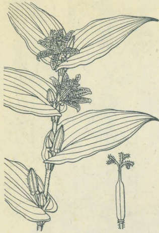
第 2260 圖