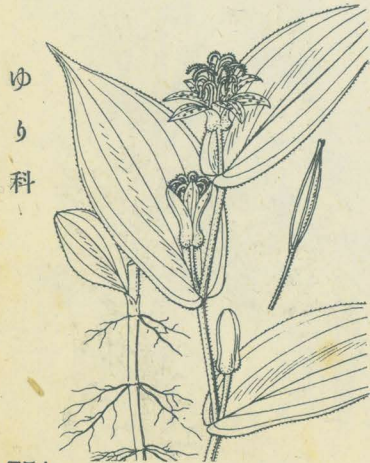
第 2262 圖

山地岡陵ノ樹下ニ生ズル多年生草本ニシテ高サ30-50cm、葉ハ萌出ノ時ニハ全く無毛ニシテ倒卵狀橢圓形、底部ハ莖ヲ抱カズ、表面ハ蒼綠色ニシテ面ニ濃色油滴狀ノ斑紋頗ル分明ナレドモ、中部以上ノ葉ハ質稍薄クシテ短毛綠色ト成リ橢圓形又ハ廣橢圓形、兩面共ニ短毛ヲ布キ、底部ハ莖ヲ抱クニ至ル。九月、莖頂竝ニ上部ノ葉腋ニモ亦疎花ノ繖房花序ヲ出ダシ、花軸ニハ堅毛ヲ見ズ。花ハほととぎすニ比スレバ小形ニシテ天ニ朝フテ開ク、花蓋片ハ花梗ト共ニ其外側ニ軟毛ヲ布キ、白色ニシテ紫點アリ、中央以下ヨリ上部ハ急ニ平開シ、外花蓋三片ハ廣卵形ニシテ基部ニ囊狀突起アリ、内花蓋三片ハ狹長ナリ。雄蕊ハ六、花絲ハ湊合シテ立テ上部反卷シ頂ニ約フ有ス。子房ハ狹長、一花柱立テ上部三岐シ分枝更ニ二裂シ粒狀毛ヲ有ス。蒴果ハ直立シ長サ3cm許、披針狀三稜形、三殼片ニ開裂シ、種子ハ橢圓形ニシテ平扁ナリ。和名ハ山杜鵑ニシテ山地ニ生ズルほととぎす草ノ意ナリ。