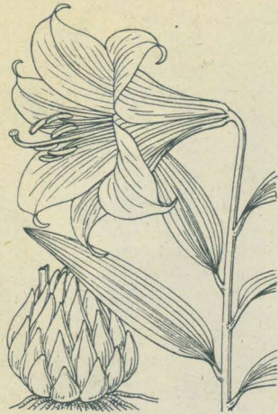
第 2224 圖