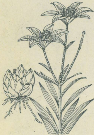
第 2225 圖

中部以西ノ山地ニ生ズル多年生草本。鱗莖ハ卵球形ニシテ扁平多肉白色ノ鱗片相重ナル。莖ハ瘦長ナル圓柱形ニシテ立ち、滑澤ニシテ高さ0.5-1mヲ算シ中邊ニ葉ヲ互生スルノ状ヤまゆりノ如シ。葉ハ狭披針形或ハ披針形、長サ10cm内外、漸尖頭、葉底ハ急ニ鈍形ヲ呈シテ短柄ト成ル。八月頃莖頂ニ二三花或ハ五六花ヲ開ク。花ハ大輪、長サ10cm内外、漏斗狀鐘形ニシテ淡紅色ヲ呈シ花容愛スベシ。花蓋片ハ廣倒披針形、下部相倚リテ筒形ヲ成シ、内面ニハ細點ヲモ節ラズ。雄蕊雌蕊ハ一束ト成リテ少シク花外ニ出ヅ。葉極メテ狭長ニシテ花香峻烈ナルヲにほひゆり ( var. angustifolium Makino ) ト云フ。又往々葉ニ白覆輪ノ者アリ、ふくりんささゆり ( var. albomarginatum Makino ) ト云フ。和名僅百合ハ葉狀ニ基キ、さゆりハ蓋シ早ク咲クゆりノ意カ或ハさつき (五月) ゆりノ意ナラン。漢名百合 (誤用)