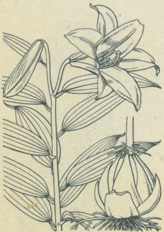
第 2226 圖

觀賞ノ爲メ栽培セラルル多年生草本ナレドモ我邦南部ノ山地ニ自生ス。鱗莖ハ白色、卵球形ニシテ數顆聚リ廣披針形ノ鱗片ヨリ成ル。莖ハ直立、綠色ニシテ無毛、高さ30-50cm、太カラズ。葉ハ散在シテ互生シ、線形或ハ線狀披針形ヲ呈シ長サ5cm内外。夏日、頂ニ二三花ヲ直立上向シテ開ク。花軸亦直立上シ紫點アリ。花ハ濃赤色、稀ニきひめゆりト稱スル黃花品アリ、徑5cm許。花蓋片ハ底部ヨリ擴ガリテ星狀ヲ呈シ、各片ハ狭ク先端ハ僅ニ外反スルノミ。内面ニハ細點有ル者多ク、外面蕾ノ時ハ綿毛ヲ被ル。雄蕊ハ雌蕊ト同長ナレドモ花蓋片ヨリハ短クシテ中央ニ立ツ。花粉ハ花蓋片ト同色ヲ呈ス。和名姫百合ハ花容ノ小ニシテ可憐ナルニ基ヅク。