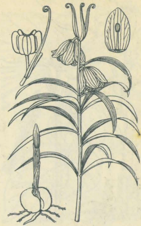
第 2216 圖