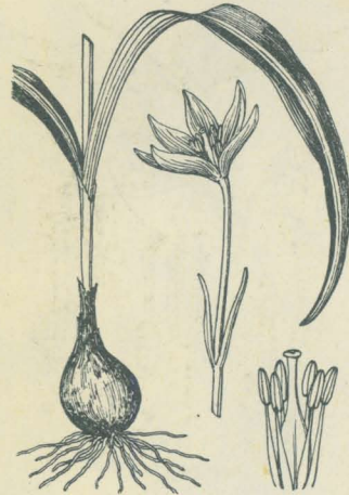
第 2214 圖