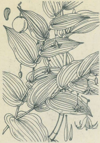
第 2200 圖