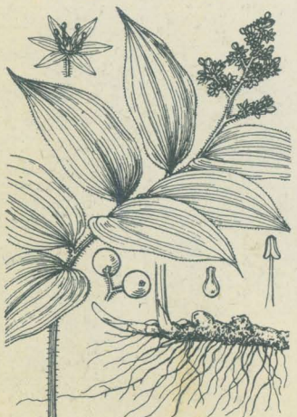
第 2202 圖

中部以北ノ高山針葉樹林下ニ生ズル多年生草本。根莖ハ細長ク、白色ニシテ地表近クヲ横行シ時ニ長ク、屢々分枝ス。先端ハ節間短縮シ、頂部ニ莖ヲ立ツルコト10-25cm。莖ハ細クシテ平滑、中部ヨリ上方ニ二三葉ヲ互生ス。葉ハ心臟形或ハ三角狀心形、鋭尖頭、深心臟底ニシテ薄質綠色、全邊ナレドれんす下ニテハ圓キ低波アリ。五六月、莖頂ニ長サ2-3cm許ノ稍疎總狀花序ヲ着ケ小白花ヲ開ク。花蓋片四箇、平開シ上半反卷ス。雄蕊四箇、子房ハ卵球形。漿果ハ小球形ヲ成シ半熟時ハ紫斑アリテ後赤熟ス。本種ニ似テ下野日光・樺太等ニハこまひづるさう ( M. bifolium DC.) アリ。葉狭ク三角形ヲ呈シ其葉縁之レヲ鏡檢スルニ鋸齒アルヲ以テ區別シ得。和名舞鶴草ハ葉狀ニ基ツク。