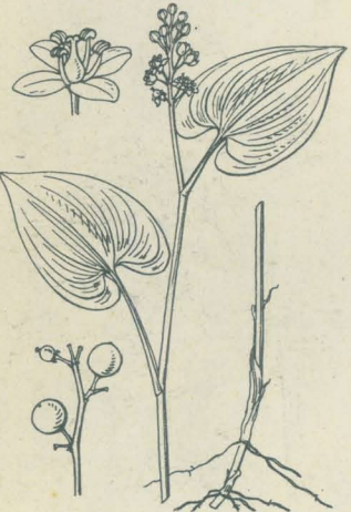
第 2201 圖

中部以北ノ高山溪側ニ生ズル多年生草本。莖ハ高さ50-100cm、中部ニテ又狀ニ五六分枝シ、葉ヲ左右ニ多數互生ス。葉ハ卵狀橢圓形長サ5cm内外、鋭尖頭、葉底ハ莖ヲ抱キ、表面ハ黄綠色裏面ハ蒼白色ヲ帶ブ。平坦ニシテ五七ノ縦脈陥入シテ走り、邊緣ニ多少ノ起伏ヲ成シ又微齒ヲ有セリ。七月頃各葉下ニ綠白色ノ一花ヲ懸垂シテ開ク。長梗アリテ途中ニ於テ一回膝曲スル特徴アリ。是レハ腋出セル花梗ハ莖ト融着シテ其上方ノ葉ノ下ニ至リテ始メテ離ルルニ因ル。花蓋六片ハ披針形、下半鐘形上半強ク反卷ス。雄蕊ハ六箇、葯ハ尖リテ大ナリ。雌蕊ハ花柱ハ長シ。後チ卵狀球形ノ漿果ヲ懸垂シ、長サ1cm許、八月既ニ紅熟ス。