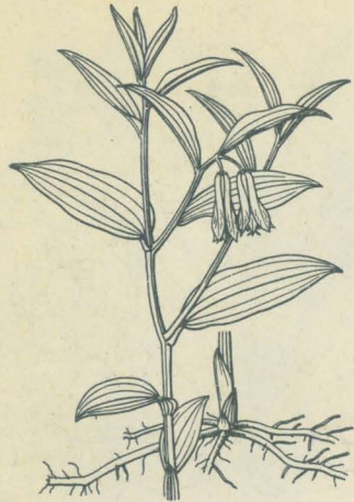
第 2194 圖