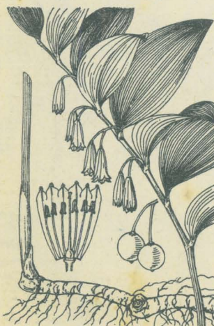
第 2196 圖

中部北部高山ノ樹陰ニ生ズル多年生草本。地下莖ハ短クシテ鬚根ヲ發出ス。葉ハ二乃至五片根生シ、長橢圓形ヲ成シ先端短ク尖リ下部ハ漸次ニ狹窄ス、稍厚質且ツ柔クシテ大ナリ。六月頃、葉中ヨリ花莖ヲ出シ、梢部ニ小花梗アル白色ノ小花ヲ開キ短總狀花穂ヲ成ス。花蓋六片ニシテ同形、平開シ、各片披針形ニシテ鈍頭。六雄蕊ハ花蓋ノ基部ニ着ク。子房ハ三室、花柱ハ子房ヨリ長ク細圓柱形、柱頭三岐ス。花後其莖著シク高く伸長シ、小梗モ延ビテ圓形漿果ヲ結ビ、熟シテ藍色或ハ暗藍色。種子ハ細小ニシテ褐色ナリ。和名燕おもとハ草狀ニ基ケドモ燕ハ如何ナル意ナルカ未詳ナリ。