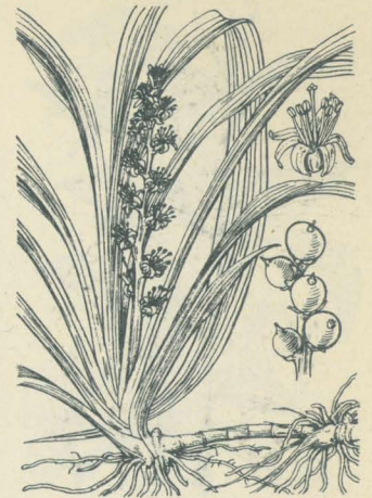
第 2192 圖