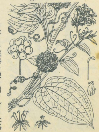
第 2175 圖

原野ニ生ズル多年生攀援蔓本ニシテ其綠莖長ク延ブ。葉ハ互生シテ短柄ヲ有シ、卵狀楕圓形ニシテ先端鋭ク尖リ、底部ハ多少心臟形ヲ呈シ、全邊ニシテ數條ノ卷鬚アリ。葉柄ノ基部ニ托葉ノ變形ナル卷鬚アリテ他物ニ纏フ。夏日、葉柄ヨリモ長キ花莖ヲ抽キ、十五乃至三十ノ小花梗ヲ着ケ淡黃綠色花ヲ球狀ノ繖形ニ着ク。雌雄異株。花蓋ハ六片、幅狭クシテ平開ス。雄花ニハ花絲長キ六雄蕊立チ子房ノ痕跡ナシ。雌花ニハ短キ三花柱ヲ有セル三室ノ子房ト假雄蕊トアリ。花後黒色ノ果ヲ結ブ。和名しほでハ北海道あいの土言ノしゅうおんてニ由來セシ者ナリ。漢名牛尾菜(慣用)