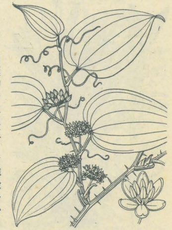
第 2174 圖

諸國ノ山地ニ生ズル落葉攀援藤本。莖ハ瘦長綠色ニシテ堅ク稜アリ、他物ニ攀チ或ハ彎曲シテ直立ク高さ1-2m以上ニ達ス。莖面ニ大小不同ノ剛直刺ヲ直角ニ生ズ。葉ハ互生ニシテ柄アリ、葉柄基脚ノ上部ニハ左右ニ一對ノ卷鬚ヲ生ジ他物ニ卷ク。葉面ハ卵圓形或ハ卵狀心臟形、長さ3-5cm、葉頭ハ急遽鋭尖頭、邊緣ハ往々波皺ヲ生ジ、表面濃綠色、光澤ニ富ミ時ニ黃斑ヲ飾ル。三乃至五行脈顯著ナリ。夏日葉腋ニ一梗ヲ抽キ、梗ノ長サ葉柄ノ超エ梗端ニ五六花ヲ繖狀ニ着ク。雌雄異株。花ハ黃綠色ニシテ廣鐘形ヲ成シ、長さ2-3mm、花蓋六片ハ楕圓形、多少肉質ナリ。雄花ハ六雄蕊ヲ有シ、雌花ニハ一子房アリ。花後小球狀ノ漿果ヲ結ビ、黒熟ス。和名山何首烏ハ山地ニ生ジ其葉蓋シ何首烏葉ニ似タル乎或ハかしゅうらいも葉ニ似タル乎ヲ以テ名ケシナラン。