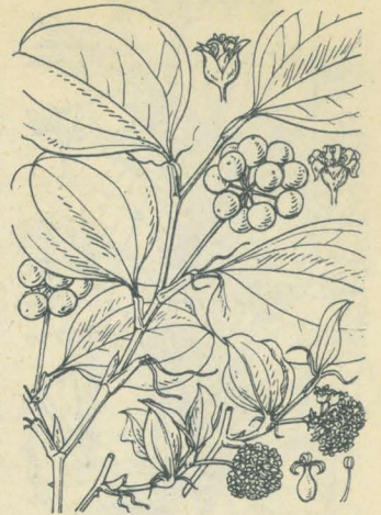
第 2173 圖

山野ニ生ズル攀援灌木。根莖ハ地中ニ横クハリ肥厚シテ質極メテ硬ク、不齊ニ屈曲シ、疎ニ鬚根ヲ出セリ。莖ハ硬クシテ節毎ニ之曲シ、高さ70cm-2m以上ニ達シ、疎ニ刺アリ。葉ハ互生シ、圓形或ハ廣楕圓形ニシテ短キ葉柄アリ、三乃至五脈ヲ有シ更ニ網狀脈ト成ル。葉柄ノ下部兩側ニ沿着セル托葉アリテ先ハ卷鬚ト成リ強ク他物ニ纏フ。初夏新葉ノ頃、葉腋ニ花梗ヲ抽キ、黃綠色ノ小花ヲ多數繖形花序ニ着ク。雌雄異株。花蓋片ハ六ニシテ分立シ、反轉ス。雄花ニハ六雄蕊アリ。雌花ニハ三室ノ子房ヲ有シ、三花柱ヲ具フ。花後7mm内外ノ美シキ紅色果ヲ結ブ、中ニ黃褐色ノ硬キ種子アリ。葉ハ餅ヲ包ムニ用キ、根莖ハ民間藥ト成ル。世間之レヲさんきらい(山奇粮即チ土茯苓)ト云フハ非ナルヲ以テ時トシテハ本品ヲ和のさんきらいト呼バル。和名猿捕いばらハ刺アリテ猿之レニ引キ懸ル意ニテ云フ。