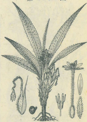
第 2163 圖