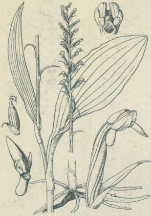
第 2093 圖