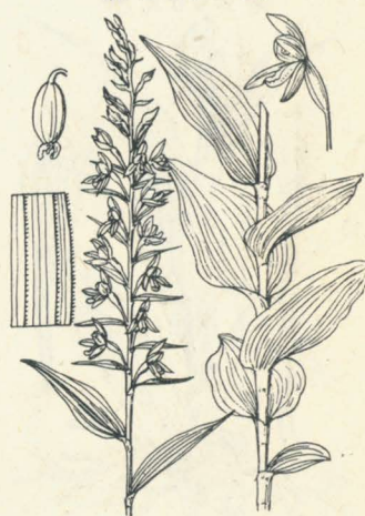
第 2079 圖