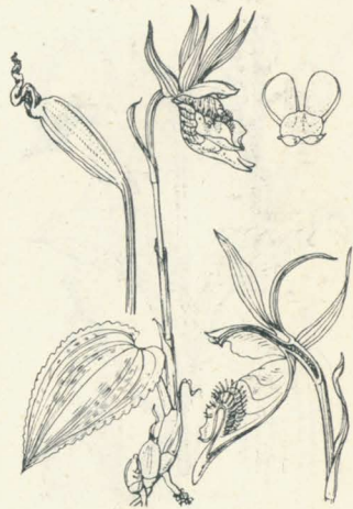
第 2061 圖