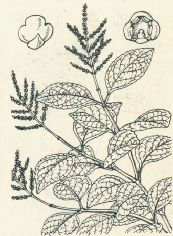
第 2031 圖