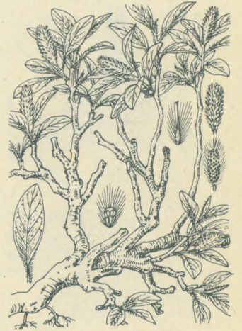
第 2025 圖