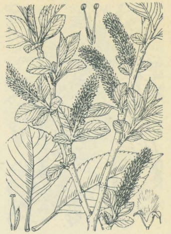
第 2024 圖