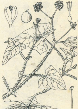
ままこのしりぬぐひ