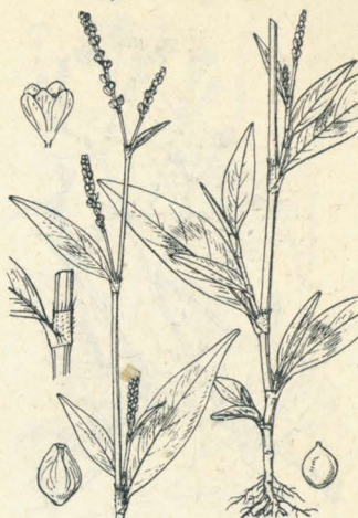
第 1862 圖