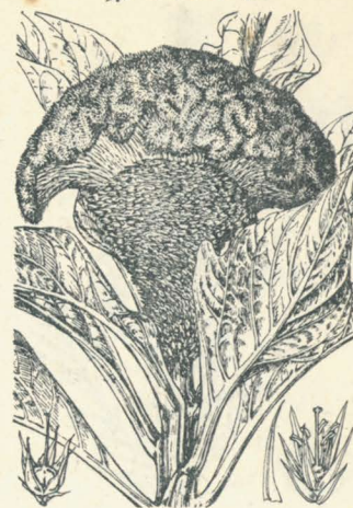
第 1826 圖