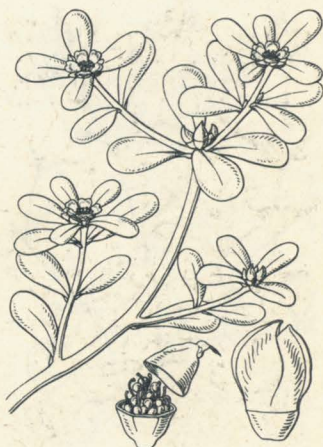
第 1803 圖