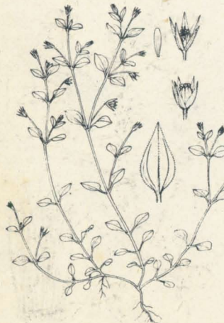
たちはこべ Moehringia trinervia Clairv. var. platysperma Makino. (= M. platysperma Maxim. )

諸國ノ山地ニ生ズル稍濁綠色ヲ呈セル一年生草本。全草軟弱ニシテ瘠長、細毛アレドモ顯著ナラス。莖ハ瘦細ニシテ直立或ハ斜上シ、通常基部ニテ岐レ又上部ニ於テ分枝シ枝ハ菲弱ナリ。葉ハ小形ニシテ對生シ、卵形或ハ長卵形ニシテ鈍頭、廣楕狀底、葉柄ヲ具ヘ、三行脈ヲ有シ質薄ク略ボ平滑ナレドモ葉裏中脈上ト葉緣トニハ細毛列生ス。夏時ニ開花シ、花ハ細小ニシテ長キ細梗ヲ有シ、細梗ハ梢ノ二枝間或ハ葉腋ニ直立シ葉ヨリ長シ。萼片ハ鏡狀披針形ニシテ鈍ク尖リ中央背部ニハ毛アリ、兩緣ハ膜質ヲ呈ス。花瓣ハ極メテ小サシ。花後卵球狀ノ蒴果ヲ結ビ其長サ宿存セル萼片ヨリ短ク、頂部ノミ開裂シテ細子ヲ吐ク。種子ハ黑色ニシテ腎形ヲ成シ一見平滑ニシテ光澤アリ。和名ハ立繁縷ニシテ立チタルはこべノ意ナリ。