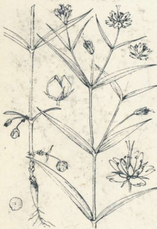
くしろわちがひ Pseudostellaria sylvatica Pax. (= Krascheninnikowia sylvatica Maxim. )

特ニ北地ニ見ル多年生ノ小草本ニシテ地中ニ直下スル塊根ハ單一ニシテ小蕪菁根狀ヲ呈ス。莖ハ直立シテ高サ20cm許ニ及ビ細長ニシテ毛條アリ。葉ハ無柄ニシテ對生シ、下部ノ者ハ線形、上部ノ者ハ線狀披針形ニシテ先端長ク尖リ、底部ノ邊緣ニハ毛ヲ有ス。六月ノ候梢上葉腋ヨリ疎枝ヲ岐チ白色ノ有梗花ヲ開キ天ニ朝フ。花梗ハ細長ニシテ毛條アリ。綠萼五片、披針形ニシテ鈍頭ナリ。花瓣モ亦五片、倒卵形ニシテ先端二裂ス。十雄蕊。卵形ノ子房頂ニ三花柱アリ。蒴果ハ卵圓形ニシテ三裂片ニ開裂ス。別ニ莖ノ下方節部ヨリ有梗ノ閉鎖花ヲ生ズル特徴アリ。和名ハ釧路輪違ニシテ本種初メ北海道釧路國ニ於テ採集セラル故ニ其名アリ。