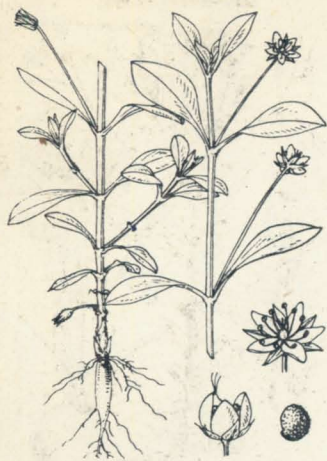
わちがひさう Pseudostellaria heterantha Pax. (= Krascheninnikowia heterantha Maxim. )

山地ノ林中ニ生ズル多年生小草本ニシテ塊根ハ單一ニシテ地中ニ直下シ紡錘形ヲ呈ス。莖ハ單一ニシテ直立シ、細長ニシテ毛條ヲ有シ高サ8-15cm許アリ。葉ハ對生シ、下部ノ者ハ倒披針形、上部ノ者ハ卵狀披針形或ハ披針形ニシテ鈍頭ヲ有シ、底部ハ邊緣ニ疎毛ヲ有シ狭窄シテ葉柄ト成ル。五月ノ候上部葉腋ヨリ細長ニシテ毛條ヲ有スル花梗ヲ抽テ頂ニ一白花ヲ開キ天ニ朝フ。綠萼五片、披針形ニシテ鈍頭、長サ4-5mm、邊緣ニ毛ヲ有ス。花瓣モ亦五片、倒披針形ニシテ稍鈍頭ヲ呈ス。十雄蕊アリテ葯ハ紫色。子房ノ頂ニ三花柱アリ。別ニ莖ノ下部葉腋ヨリ閉鎖花ヲ生ズルノ特徴アリテ該花ハ四數ヨリ成ル。蒴果ハ四裂シ細種子ヲ散ズ。和名輪違草ハ往昔此草ノ名稱尙不明ナリシ時無名ノ標識トシテ其盆栽ニ輪違ヒノ符ヲ記セシ事アリ由テ終ニわちがひさうノ名ヲ生ゼント謂フ。