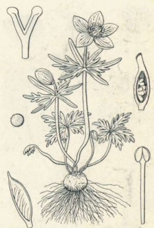
第 1719 圖