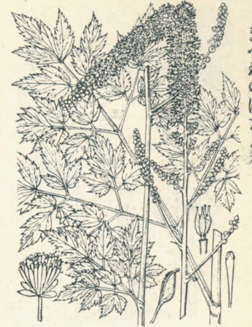
第 1706 圖