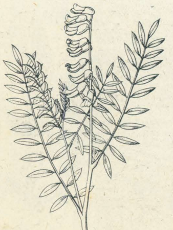
第 1290 圖

普通ニ山野ニ見ル多年生草本。嫩苗ハ暗色ヲ帶ブ。莖ハ圓柱形綠色ニシテ直立シ、高サ60-90cm許。葉ハ有柄互生シ奇數羽狀複葉ニシテ長サ15-20cm許アリ。小葉ハ長橢圓形或ハ長卵形ニシテ先端ハ鈍頭或ハ銳頭、底部ハ圓形ニシテ長サ2-3cm許アリ。初夏、梢上ノ莖端并ニ枝端ニ總狀花序ヲ成シテ多數ノ淡黃色蝶形花ヲ着ク。花穂ノ長サ能ク成長セシ者ハ20-25cmニ及ブ。萼ハ筒狀ニシテ先端五淺裂ス。旗瓣ノ上部ハ上反シ、翼瓣龍骨瓣ハ之レヨリ短小ナリ。花後細長ノ莢ヲ結ブ。長サ7cm許、縊レアル細圓柱狀ニシテ先端尖レリ。根ヲ生藥トシテ用キ、驅蟲劑トシテ莖葉ノ煎汁ヲ使用ス。和名くらはらハ眩草(くらはらのき)ノ略セラレタルモノニシテ其苦キ根汁ヲ嘗レバ目眩メク故云フ。