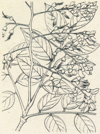
第 1288 圖