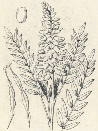
第 1289 圖

山中ニ自生スル大ナル落葉喬木。幹ハ直立シテ高聳シ分枝ス。葉ハ奇數羽狀複葉ヲ成シテ互生シ、全長20-25cmニ達シ、短葉柄アリ。小葉ハ互生シ對ヲ成サズ、長橢圓形ニシテ先端尖リ、底部ハ鈍形或ハ圓形、邊緣ニ鋸齒ナク、葉裏ニ細毛アリ。葉柄ノ基部ハ膨ミテ中ニ葉芽ヲ閉藏ス。夏日、梢頭ノ枝端ニ長サ20cm許ノ複總狀花序ヲ成シ白色ノ蝶形花ヲ開ク。美麗ニシテ長サ15mm許。萼ハ鐘狀、上部五淺裂ス。雄蕊十箇ニシテ離生シ、花後扁平ナル長キ莢ヲ結ビ翼アリ。通常開裂セズ、表面ノ網眼ハ顯著ナラズ、少數ノ種子ヲ包ム。種子ハ扁平ニシテ長橢圓形ヲ成シ褐色ヲ呈ス。和名藤木ハ其葉ヲふぢニ比シテノ稱、山槐モ亦其葉ヲゑんじゅ即チいぬゑんじゅニ比シテノ名ナリ。