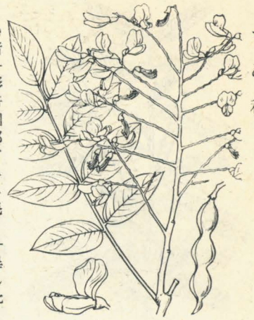
第 1291 圖

觀賞ノ爲メ時ニ人家ノ庭ニ栽培セララルル多年生草本。莖葉共ニくらはらト同ジト雖ドモ、花ハ暗紅色ヲ帶ブルヲ以テ異ナリ。莖ハ直立シ高サ90cm内外。葉ハ奇數羽狀複葉ニシテ互生シ、葉柄アリ。小葉ハ長橢圓形ニシテ多數相並ビ、長サ2-3cm許ナリ。初夏、莖頂ニ暗紅色ヲ帶ブル多數蝶形花ヲ總狀花序ニ綴ル。花穂ハ稍大ニシテ各花ニハ短小梗ヲ有シ、花長凡15mm許アリ。萼ハ形テ大ニシテ斜形ヲ呈セル筒狀ヲ成シ、長サ7mm許。雄蕊十箇、子房ハ有毛ナリ。後縊レアル細圓柱狀ノ莢ヲ結ブ。