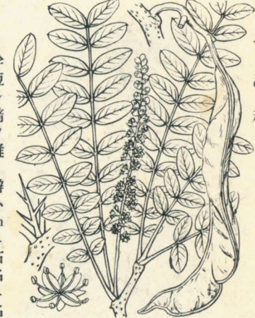
第 1292 圖

(= Styphnolobium japonicum Schott. ) 支那ノ原産ニシテ往時同國ヨリ渡來シ、今ハ諸處ノ人家ニ栽植セル落葉喬木ニシテ高サ凡 15-25mアリ。幹ハ直立シテ分枝シ、小枝ハ圓柱形ニシテ綠色ナリ。葉ハ互生シテ葉柄ヲ具ヘ、奇數羽狀複葉ニシテ長サ15-25cm、小葉ハ長橢圓形或ハ長卵狀橢圓形ヲ成シ、先端稍尖リ、底部ハ圓形、表面綠色、裏面綠白色ニシテ短柔毛アリ。托葉ハ脱落ス。夏秋ノ候、梢上ノ小枝端ニ複總狀花序ヲ成シテ淡黃白色ノ蝶形花ヲ多數ニ開ク。萼ハ鐘狀ヲ成シ、邊緣ニ五齒ヲ刻ミ、短毛ヲ有ス。旗瓣ハ廣心臟形ニシテ短キ花爪アリ。雄蕊十、花絲ハ離生、長短アリ。莢ハ長サ2.5-5cm、一乃至四種子ヲ包ミ、肉質ノ連珠狀ヲ呈シ下垂ス。種子ハ腎臟形ニシテ褐色。和名ゑんじゅハ古名ゑんにすノ轉化セシモノナリ、蓋シ此名ハ今云フいぬゑんじゅノ本稱ナラント考フ。