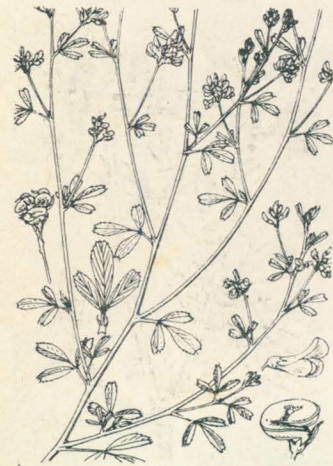
第 1277 圖

歐洲原産ニシテ徳川時代ニ渡來シ野生シテ遂ニ歸化植物ト成リシ越年生草本。根ハ短ク、莖ハ分枝シ地ニ伏シ或ハ傾上シ、稀ニ長茂セル草中ニ在テハ莖長ク傾テ立テリ。長サ7-60cm許、全株有毛。葉ハ有柄、時ニ甚ダ葉柄長ク、三小葉ヲ有ス。小葉ハ倒卵形或ハ圓形、基部ハ圓ク或ハ楔形ヲ成ス、上部ニ於テハ細鋸齒アリ。托葉ハ全邊又ハ鋸齒アリ。春日初夏、葉腋ヨリ長キ花梗ヲ出シ、其上部ニ多數黄色ノ小蝶形花ヲ集メ着ケ、花時ニハ頭狀ヲ呈スレドモ後ニハ稍延ブ。花ハ2-4.5mm許。果實ハ腎臟形ヲ成シ、刺ナク、終ニ黒色トナリ、縦紋アリ。肥料及牧草トス。和名ハ米粒馬肥シノ意ニシテ其果實米粒ノ如キニ基ク。漢名 天藍(誤用)、是レ蓋シラまごやし乎。