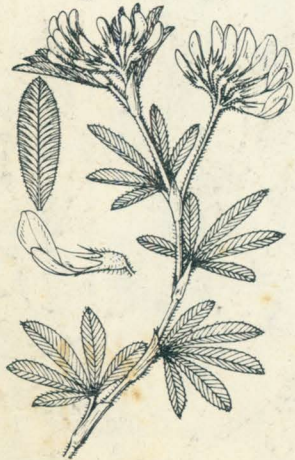
第 1278 圖

歐洲地中海地方ノ原産ニシテ牧場用トシテ栽培セラルル多年生草本ニシテ我邦ヘハ明治初年ニ渡來セリ。通常高サ 30-90cm許ニシテ毛無シ。莖ハ直立シテ分枝シ中空ナリ。葉ハ互生有柄ニシテ三小葉ヨリ成リ、小葉ハ長橢圓形乃至倒披針形ヲ成シ、底部ハ楔形ヲ呈ス。上半ノ邊緣ニハ鋸齒アリ、先端ハ鋭キ一齒ニ終ル。托葉ハ顯著ニシテ鉞狀ヲ成シ全邊ナリ。夏日、莖梢葉腋ニ花梗ヲ出シ短總狀花序ヲ成シテ多數ノ淡紫色蝶形花ヲ着ク。花長約9-10mm。萼ハ鐘狀ニシテ五裂シ、裂片狭クシテ尖リ同形ナリ。莢ハ多少毛ヲ帶ビ通常二三回螺旋シ多種子ヲ藏ス。牧草ニ用キ俗ニあるふあるふや或ハるさーんと呼ブ。和名紫馬肥シノ紫ハ花色ニ由ル。