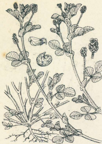
第 1276 圖