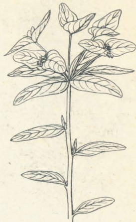
第 1123 圖

多年生草本ニシテ山野ニ生ズ。莖高サ 30cm 内外、狹長ナル圓柱形ニシテ直立シ、平滑無毛、綠色ニシテ紅紫ヲ帶ビ、切レバ白汁ヲ出ス。葉ハ互生シ、無柄ニシテ狹長長橢圓形或ハ倒披針形、鈍頭、底部ハ狹窄ス。莖端ニ披針形ノ五葉輪生シ繖形ニ枝ヲ分ツ。四五月花ヲ着ク。苞葉ハ卵形・三角狀卵形或ハ卵狀廣橢圓形ヲ成ス。小花序ハ一見一花ノ如ク、小總苞ハ融合シテ壺狀ヲ成シ、長サ 3mm、褐紫色、中ニ一雌蕊ヨリ成ル一雌花ト、一雄蕊ヨリ成ル數箇ノ雄花トヲ容ル。小總苞ノ腺體ハ三日月形、紅紫色ヲ呈ス。花柱ハ長ク先端二岐ス。蒴果ハ圓形平滑、三胞室ヲ成シ、三殼片ニ開裂ス。種子ハ卵圓形、平滑ナリ。有毒植物。和名ハ夏燈臺ノ意、夏ハ其生ズル時期ヲ表ス。漢名 甘遂 (誤用)