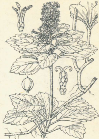
第 1118 圖