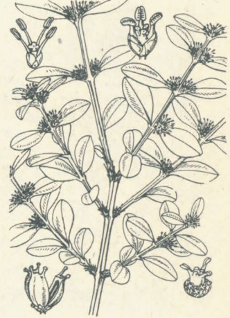
第 1119 圖